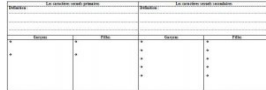
Tableau des caractères sexuels